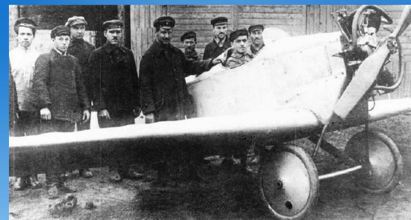
А.Н.Туполев (5 слева) у своего первого самолета

Туполев Андрей Николаевич основоположник строительства первых цельнометаллических самолетов в СССР (АНТ-3, АНТ-4, АНТ-6, тяжелые самолеты ТБ-1, ТБ-3). С 1924 года под руководство Туполева было спроектировано свыше 100 типов самолетов (гражданских и военных), 70 из них выпускались серийно. Будучи репрессирован, находясь в заключении (1937-1941), создал большое число самолетов - бомбардировщиков, торпедоносцев и других, прекрасно показавших себя во время Великой Отечественной войны.