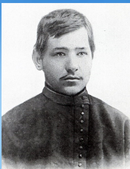
Андрей Туполев, 1907 г.

Андрей Николаевич Туполев родился в с. Пустомазово Тверской губернии в 1888 году в семье провинциального нотариуса. Андрей получил сначала домашнее образование, а вскоре поступил в гимназию. После окончания гимназии в 1908 году