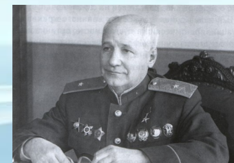
А.Н.Туполев, 1945 г.

Туполев создал также ряд типовых военно-морских торпедных катеров.