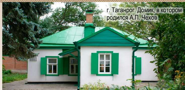
г. Таганрог. Домик, в котором родился А.П. Чехов