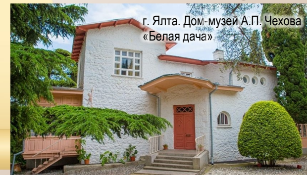
г. Ялта. Дом-музей А.П. Чехова «Белая дача»