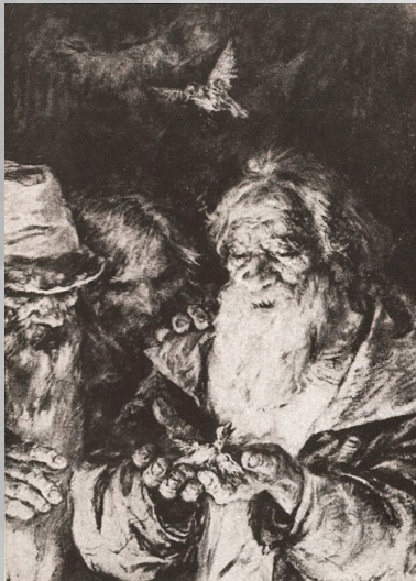
Художник В.А. Серов

Для поздней лирики Н.А.Некрасова характерны элегические мотивы. К этому периоду относятся стихотворения «Душно! Без счастья и воли...» (1868), «Три элегии» (1872), «Утро» (1871) и другие. Несмотря на тяжелую болезнь и утрату друзей, одиночество, поэт не покидает вера в счастливое будущее народа и России. Это чувствуется в его стихотворениях «Еще тройка» (1867), «Пророк» (1874), «Сеятелям» (1876).