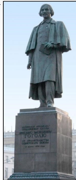
Памятник Гоголю (Москва, Гоголевский бульвар)