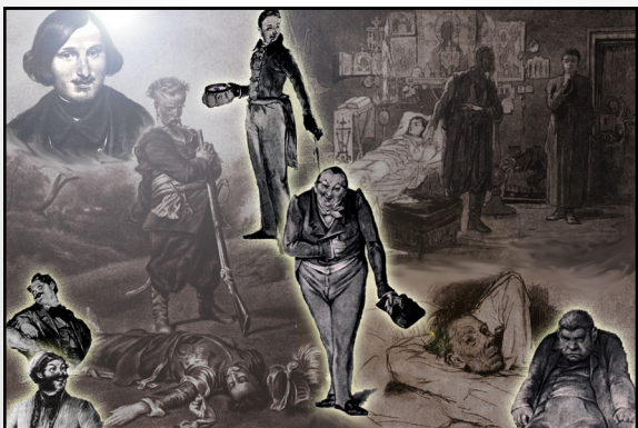
Н.В.Гоголь и герои его произведений

Некоторые из своих произведений Н.В. Гоголь продолжал дописывать, несмотря на публикацию. Многие его творения имели несколько вариаций, в том числе «Тарас Бульба» и «Вий». Опубликовав историю, Гоголь продолжал размышлять над ней, подчас дописывая или изменяя финал. Часто его повести имеют несколько вариантов концовки.