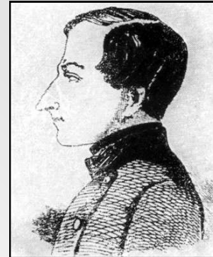
Гимназист Н.В. Гоголь, 1820-е