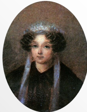
Мария Ивановна Гоголь- Яновская (рожд. Косяровская), мать писателя