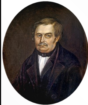
Василий Гоголь-Яновский, отец Н. Гоголя