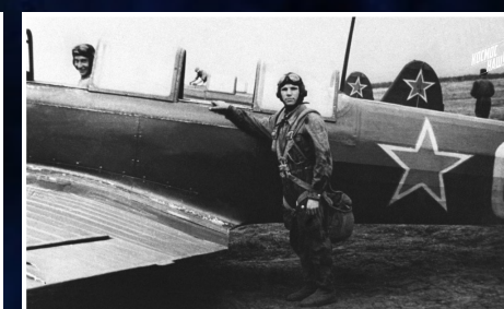
Юрий Гагарин в саратовском аэроклубе. СССР. 50-е.