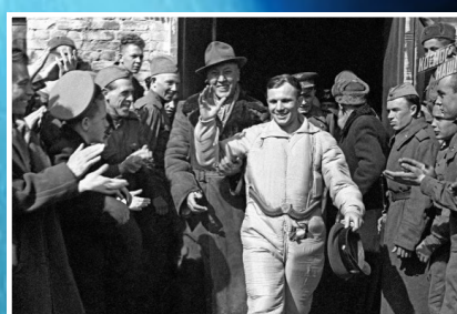
Летчик-космонавт Юрий Гагарин после приземления. Саратовская область, 12 апреля 1961 года.