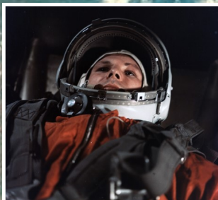
Ю.А.Гагарин в скафандре на космическом корабле «Восток»