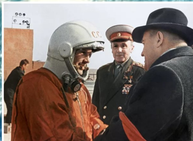
Ю.А. Гагарин и главный кон- структор С.П. Королев перед стартом корабля "Восток-1"